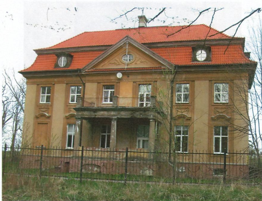
Фото 3. Южный фасад.