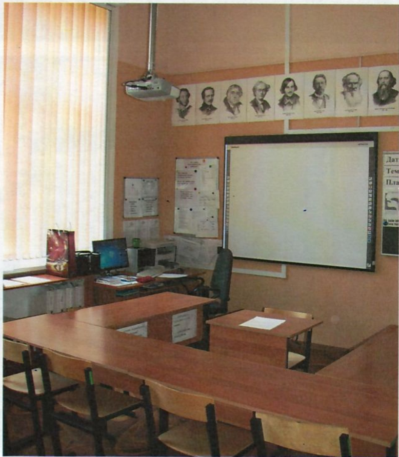
Фото 9. Интерьер учебных классов.