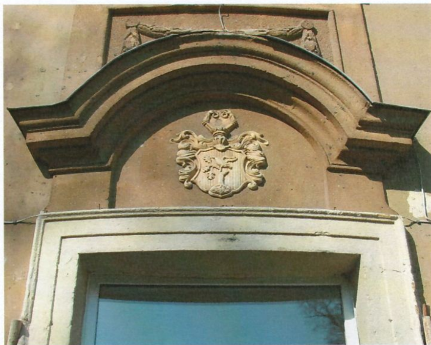
Фото 5. Семейный герб.