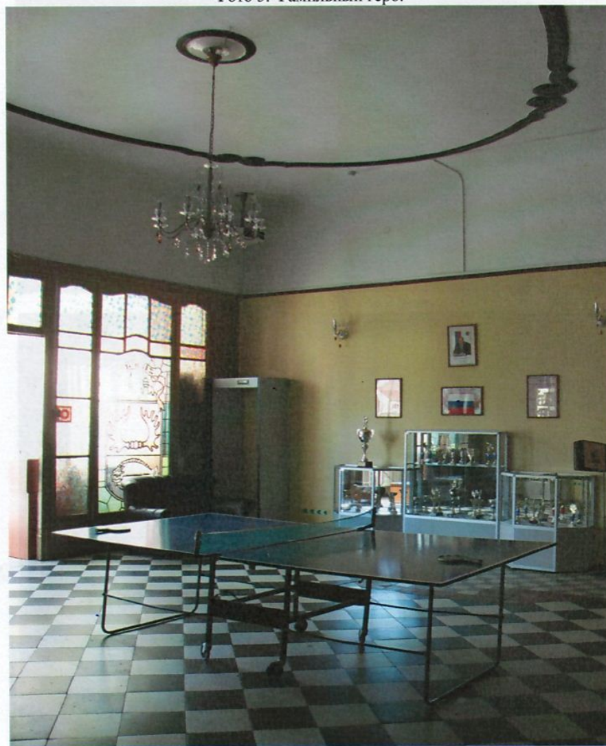
Фото 6. Главный вход, интерьер фойе.