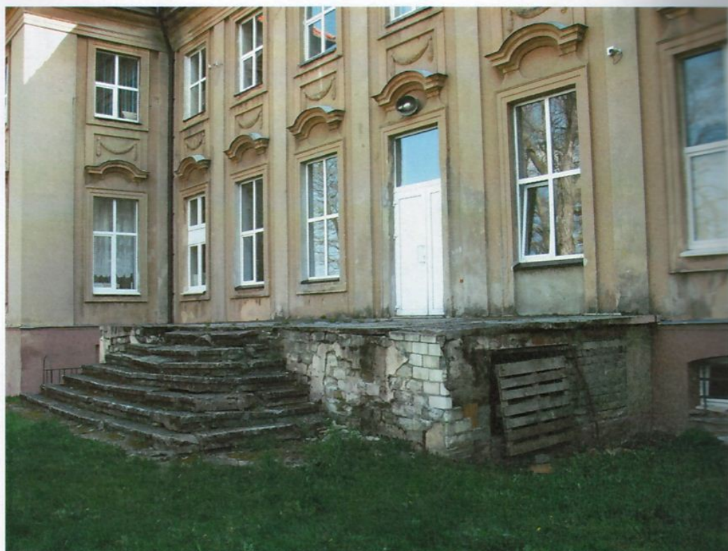
Фото 12. Крыльцо со стороны западного фасада.