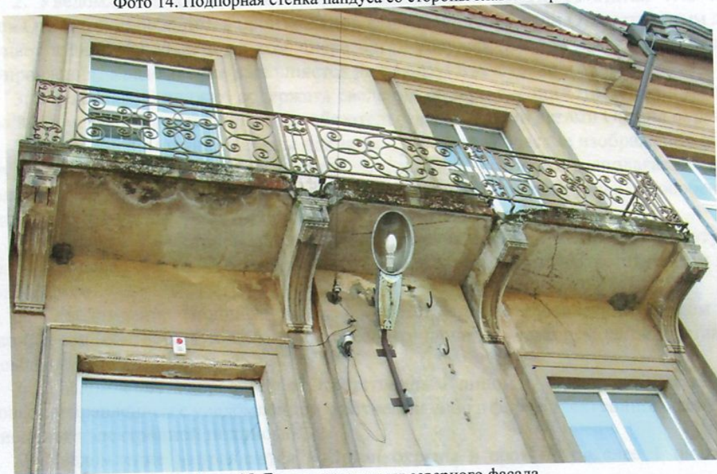
Фото 15. Балкон со стороны северного фасада.