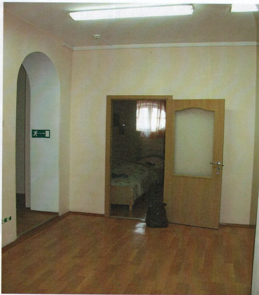
Фото 10. Спальные помещения детей .