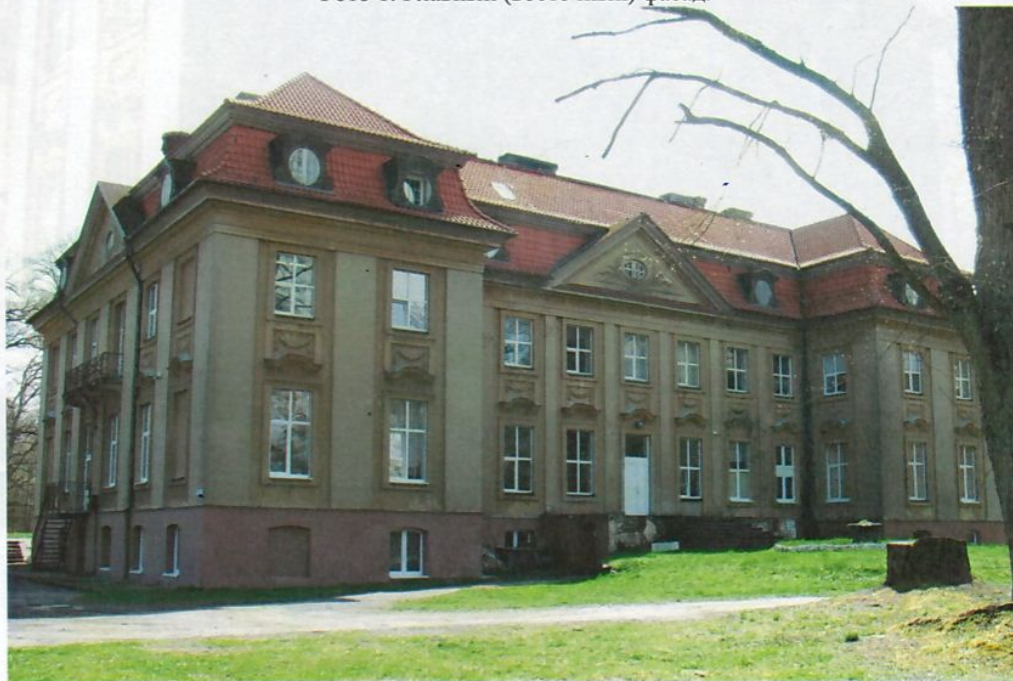
Фото 2. Западный фасад.