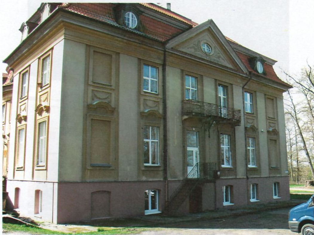
Фото 4. Северный фасад.