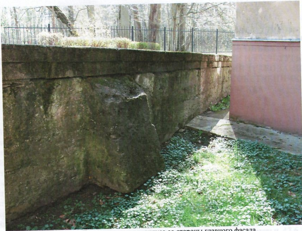
Фото 14. Подпорная стенка пандуса со стороны главного фасада.