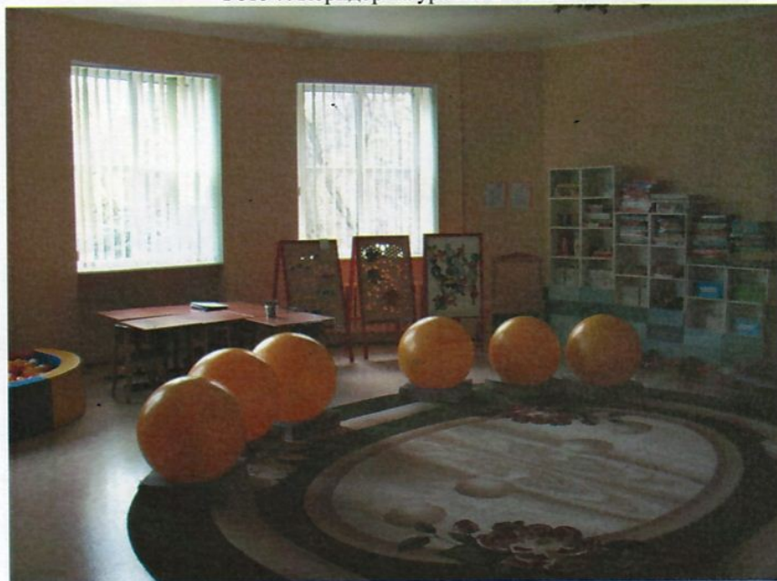
Фото 8. Кабинет (психомоторная комната).