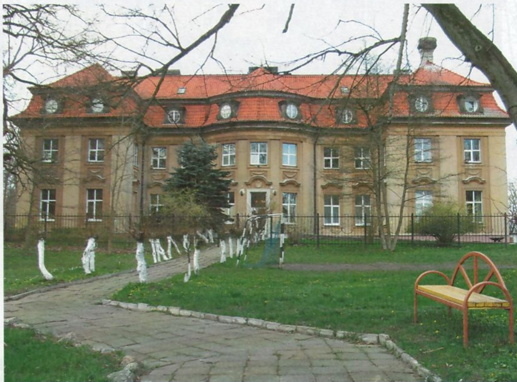
Фото 1. Главный (восточный) фасад.