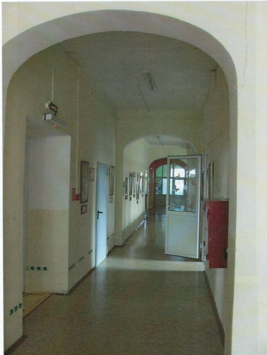
Фото 7. Коридор на уровне 2 этажа.