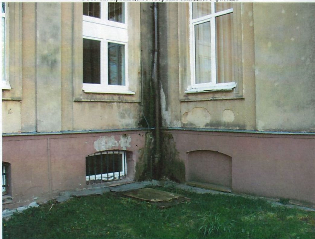
Фото 13. Состояние наружного водоотвода ливневую канализацию.